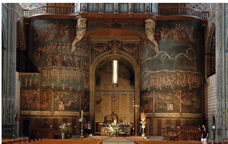
Catedral de Santa Cecília. Interior