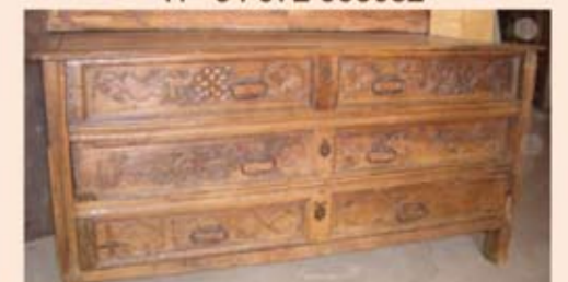
Caixonera de noguera, s. XVI (1,06 x 2 x 1,01m)

ANTIQUARI ENRIC SERRA PLANAS Plaça Sant Domènec 5. Casa Avinyó 17491 Peralada, Girona Tf +34 972 538082