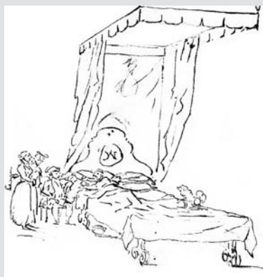
1. Dibuix de Tramulles. Llit amb peus de gall.

En un altre dibuix costumista de Tramulles (fig. 2) es documenta una escena en la cambra d'una duquesa, o similar, amb un peu