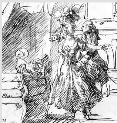
2. Dibuix de Tramulles. Pota Cabriolé.