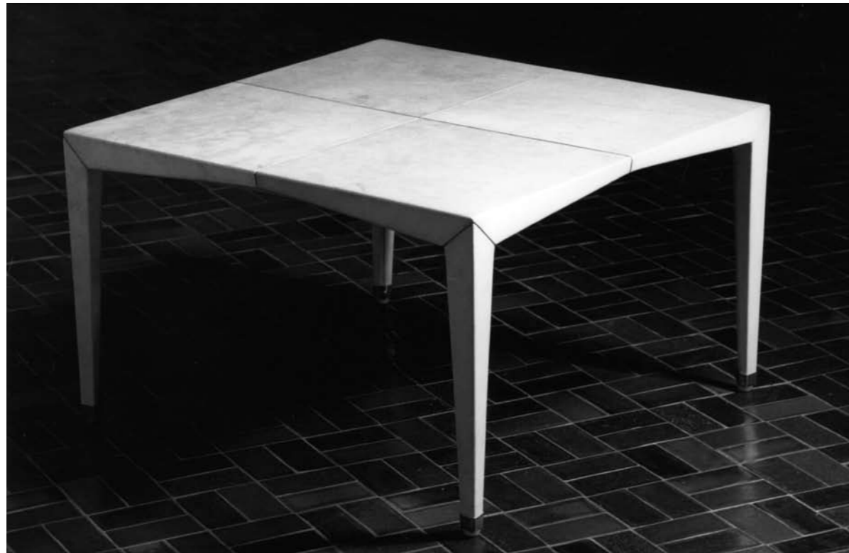
Tauleta auxiliar, molt lleugera, folrada íntegrament de pergami (1964).