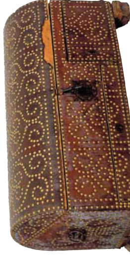
Arquilla, Catalunya, finals del segle XVII, principi del segle XVIII. Museu Monestir de Pedralbes (MMPB 115.287).