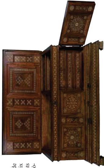
Caixa. Catalunya, finals segle XVI - inici segle XVII. Museu Monestir de Pedralbes (MMPB 115.008)

terial per a l'entapissat de les cadires i ja no apareix registrat en els documents dels següents tallis cronològics que hem estudiat. Pel que fa les característiques formals, trobem en algunes de les cases inventariades cadires d'estils poc actuals, des-