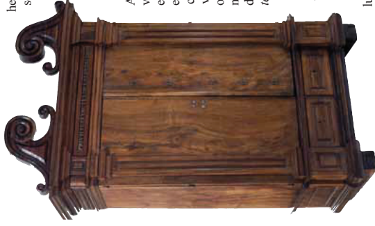
Armari dels Privilegis i Actes de la Ciutat de l'Arxiu Municipal de la Paeria de Lleida.

corrent en Leyda y son per les mans i journals de fer lo armari de privi-legis per a dita ciutat. Lo modo de la paga es que a rebur vint y sinc lliures moneda corrent ab alba-rra de manament despedit a 28 de Mars de 1686 = Coranta lliures que lo dia present ha rebut de di-versos del caixa dels Señors Paters y les restants Shiquama nou lliures