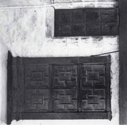
Armari encastat, 1610. Masia de Can Dorrocada, Sant Pere de Vilatorrada, Vallès Oriental. Fons Etsaudi de la Masia Catalana, Centre Excursionista de Catalunya. Foto: Antoni Galindo i Garriga, 1930. (Drets sota llicència Creative Commons: http://creativecommons.org/licenses/by-nc-nd/3.0/ (dret.c3))

CREIXELL, R. M. "Espais interiors i parament domèstic". A: VMAA. Interiors domèstics. Barcelona 1700 . Barcelona, Ajuntament de Barcelona, 2012, p. 58-98. LENCINA, X. "La història del subjecte. Inventaris post mortem: consum, microhistòria i cultura material a la Barcelona moderna". A: Estudis Històrics i Documents de les Arxius de Proïccols , XIX, 2001, p. 199-242. LENCINA, X. "Los inventarios post-mortem en el estudio de la cultura material y el consumo. Propuesta metodológica. Barcelona, siglo XVII". A: Jaume Torras i Marfany, ed. Consum, cançons de vida