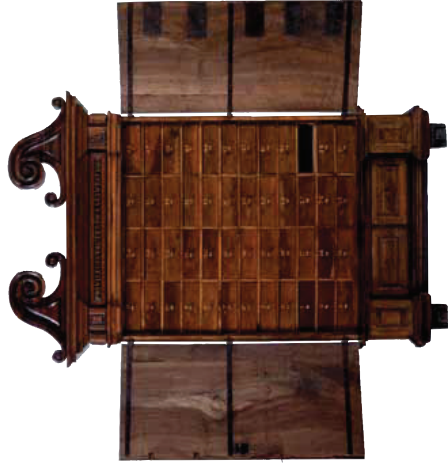
Interior de l'armari dels Privilegis i Actes de la Ciutat, de l'Arxiu Municipal de la Paeria de Lleida.

L'entaulament lleixit dues grans vo-lutes. Entremig d'aquestes, l'espai buit, deixa al descobert les cavitats de dos encaixos que donen a enten-dre la falta d'un element decoratiu central avui perdut. Considerant el caràcter rellevant de la peça, consi-derada per arxivar la documenta-ció principal de la ciutat, podem que probablement duia una forma