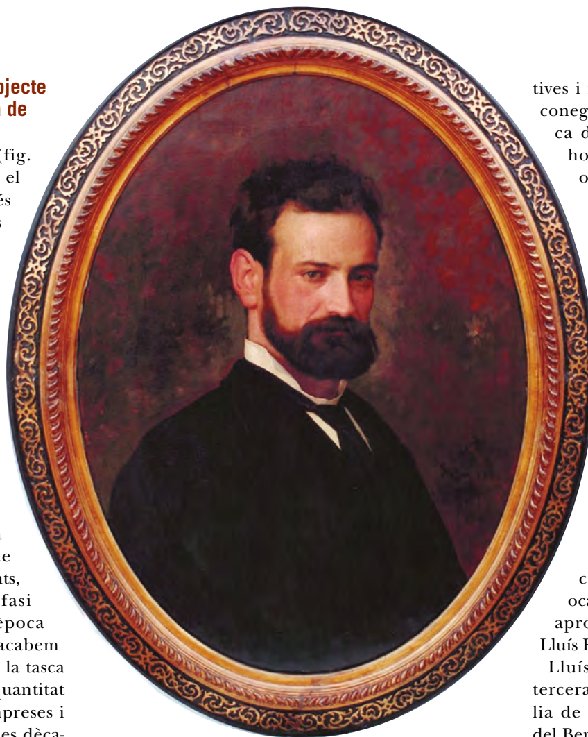
Fig. 1. Miquel Carbonell, Retrat de Lluís Folch i Brossa , c. 1880. Fundació Folch i Torres (Museu de Molins de Rei).

Lluís Folch i Brossa (fig. 1), nascut a Barcelona el 29 de juny del 1849, 1 és un dels molts moblistes i decoradors de finals del segle XIX que han quedat pràcticament sumits en l'oblit. Només el fet d'haver estat pare de destacats personatges del món de les arts i les lletres catalanes, els germans Folch i Torres, ha permès que perdurés mínimament el seu record. De fet, en parlar del mobiliari i la decoració d'interiors de la Barcelona del vuitcents, sovint posem un èmfasi tan eixordador en l'època del modernisme que acabem ensordint i difuminant la tasca que van fer una gran quantitat d'artesans, artistes, empreses i empresaris al llarg de les dècades anteriors; artífex sense els quals no podríem acabar configurant un retrat fidedigne del camí que va desembocar a l'esplendor de les arts decora-