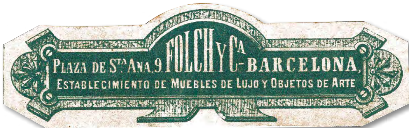
Fig. 2. Etiqueta de l'empresa Folch y Cía, 1883. Fundació Folch i Torres.