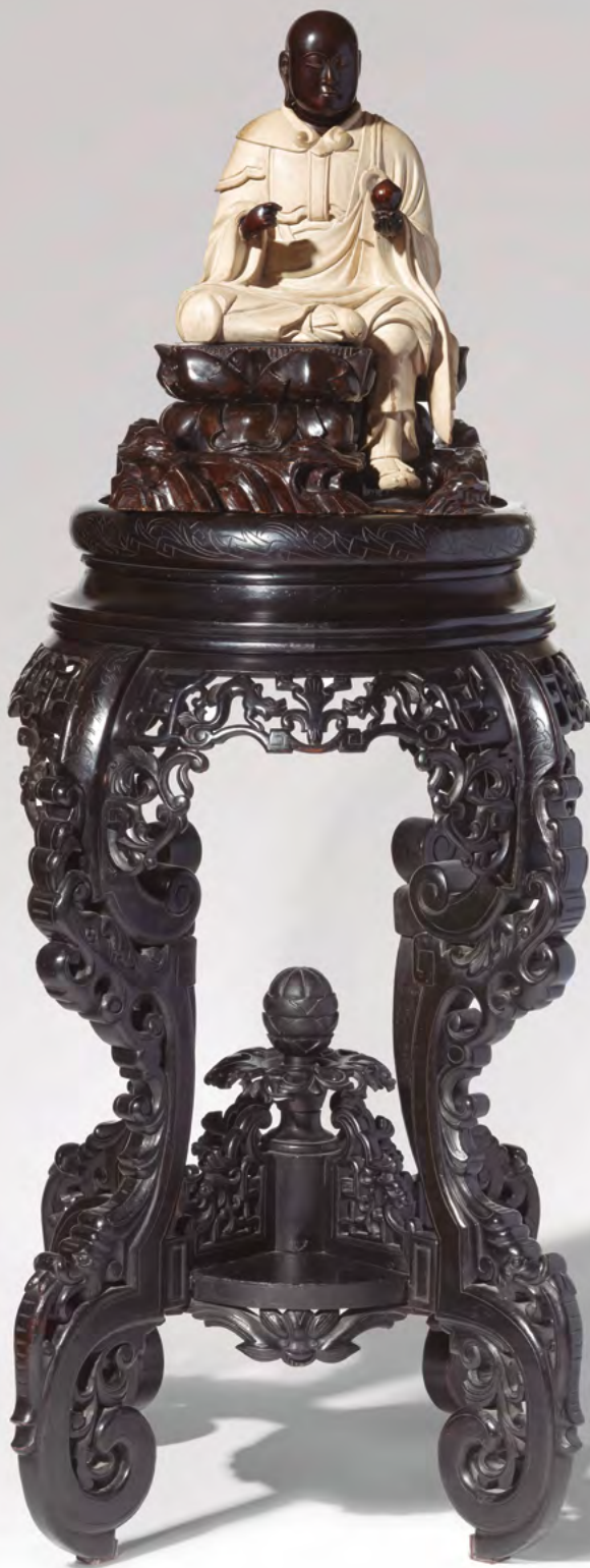
Fig. 5. Taula d'estil oriental fabricada als tallers de Lluís Folch entre el 1882 i el 1883 i adquirida pels germans Masriera Manovens per col·locar-hi una talla japonesa, col·lecció particular.

mis, a Gràcia" (MIRACLE 1971, p. 37). Era allà on Folch havia instal·lat una maquinària moderna que permetia oferir la màxima qualitat partint dels últims avenços tècnics: una producció industrial que combinava l'ús de peces prefabricades i seriades amb acabats manuals personalitzats i d'alta qualitat. D'aquests tallers, als quals segons Eulàlia Pérez van arribar a treballar més d'un centenar de persones (PÉ-