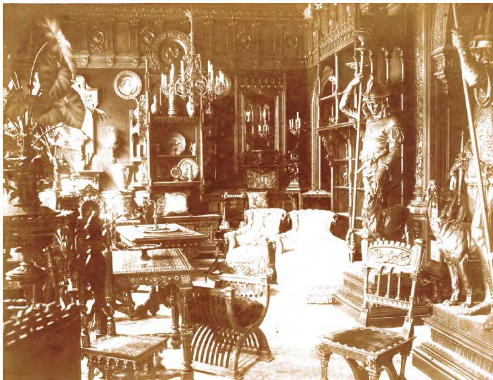
Fig. 4. Botiga de Folch y Cía acabada d'inaugurar al carrer de Santa Anna el setembre del 1883.