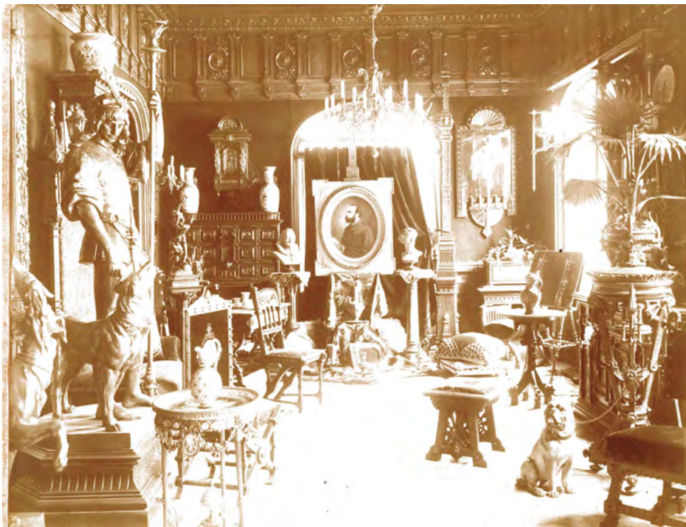
Fig. 3. Botiga de Folch y Cía acabada d'inaugurar al carrer de Santa Anna el setembre del 1883, Fundació Folch i Torres.

“El local respirava la modernitat, l'elegància i el gust pel luxe de l'època