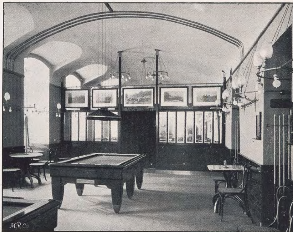
293. Billardzimmer im neuen Caféhaus „Museum“, Wien. Architekt Adolf Loos, Wien.

Keywords: Café Museum, chairs, Adolf Loos, Jacob & Josef Kohn.