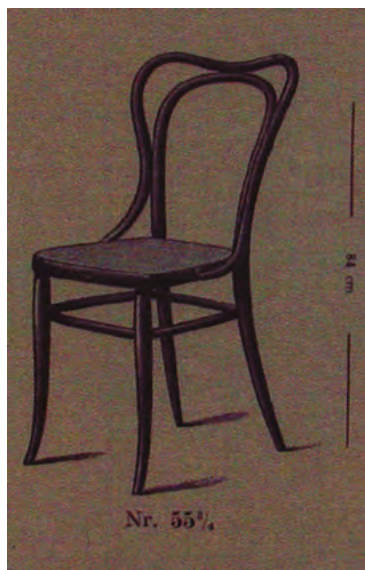
Fig. 4. Silla nº 55 del catálogo de Kohn.