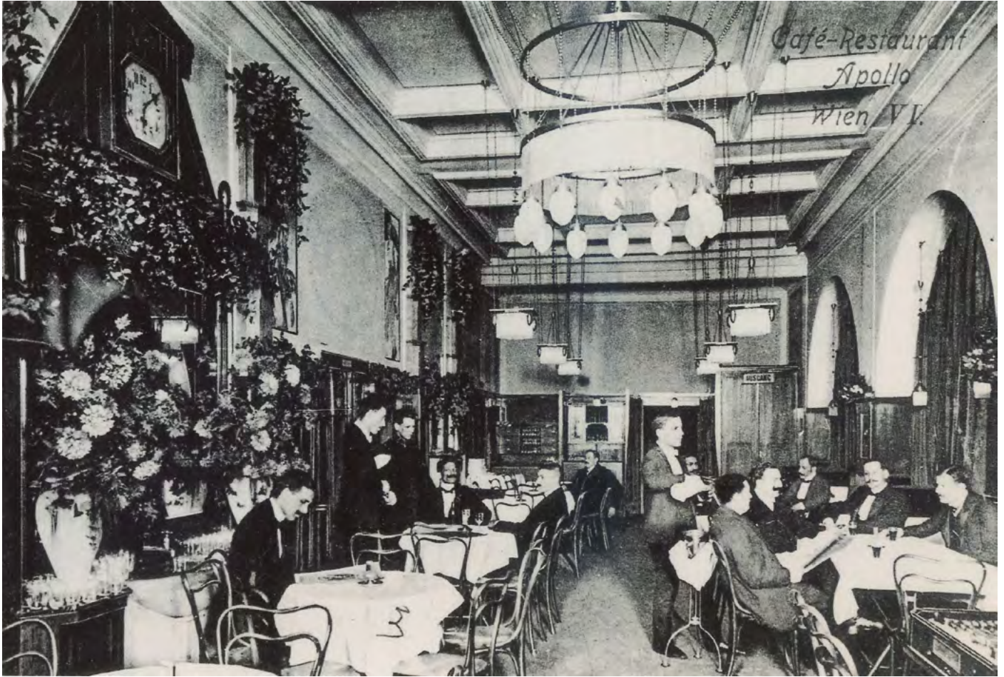
Fig. 3. Café del Apollo-Theater (Viena, 1904).

nado catálogo de 1902 donde se señala la existencia de una patente de la empresa y los modelos de sillas y sillones que la representan (fig. 5).