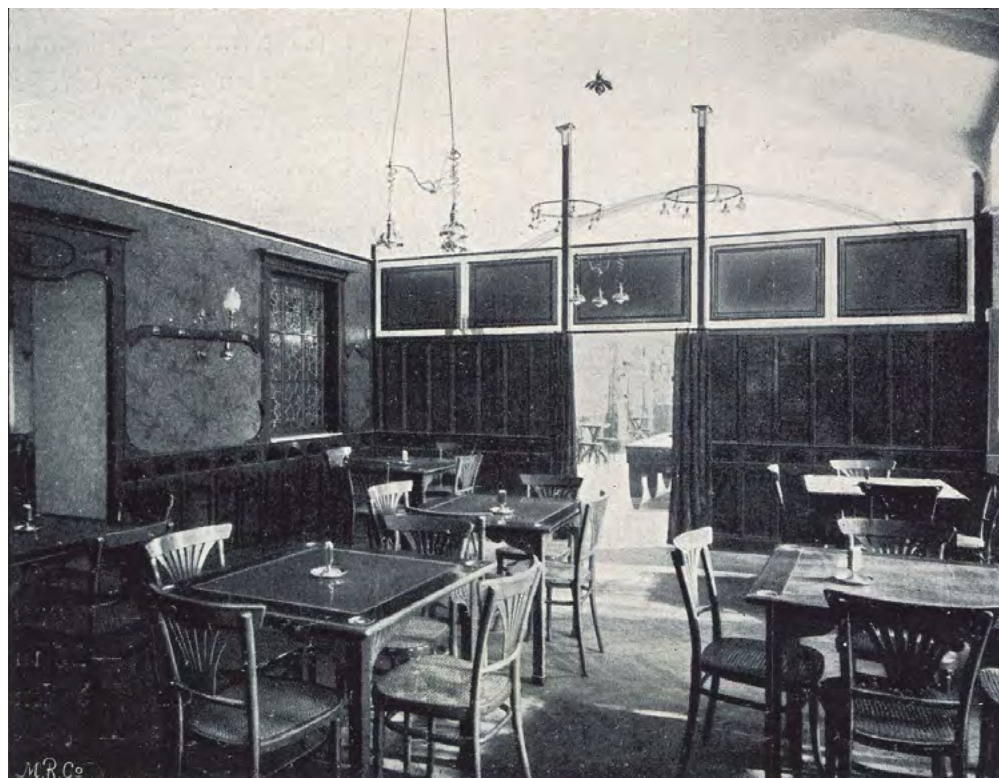
Fig. 2. Café Museum, sala de juego con sillas nº 221 de Gebrüder Thonet. Die Kunst , 1899.

Pero los datos clarificadores iban saliendo a la luz paulatinamente. En 1990 Giovanna Masobrio y Paolo Portoghesi publicaron el libro titulado Casa Thonet , incluyendo en el anexo un catálogo de Jacob & Josef Kohn de 1906. En tamaño algo reducido pero visible en la página 3 del catálogo se ve una silla que, con el nº 255, es el modelo del Café Museum. Sin embargo este dato pasaba todavía desapercibido. 3 En 1993 se puso en evidencia que había otros cafés –al menos uno– que tenían la misma silla que el Museum, como era el caso del café del Apollo-Theater de Viena (fig. 3), gra-