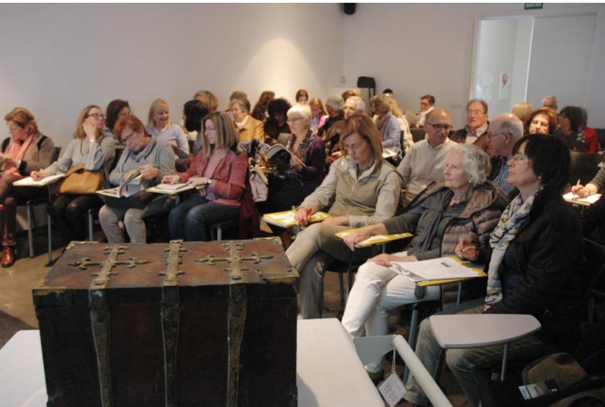
Museu de Lleida

L'estudi del moble s'aborda tant des del vessant teòric com des del pràctic. Amb diversos especialistes es contempla el context històric, els materials, les tècniques aplicades, l'ornamentació i els elements representats per tal d'obtenir l'anàlisi detallada del moble i la corresponent fitxa tècnica.