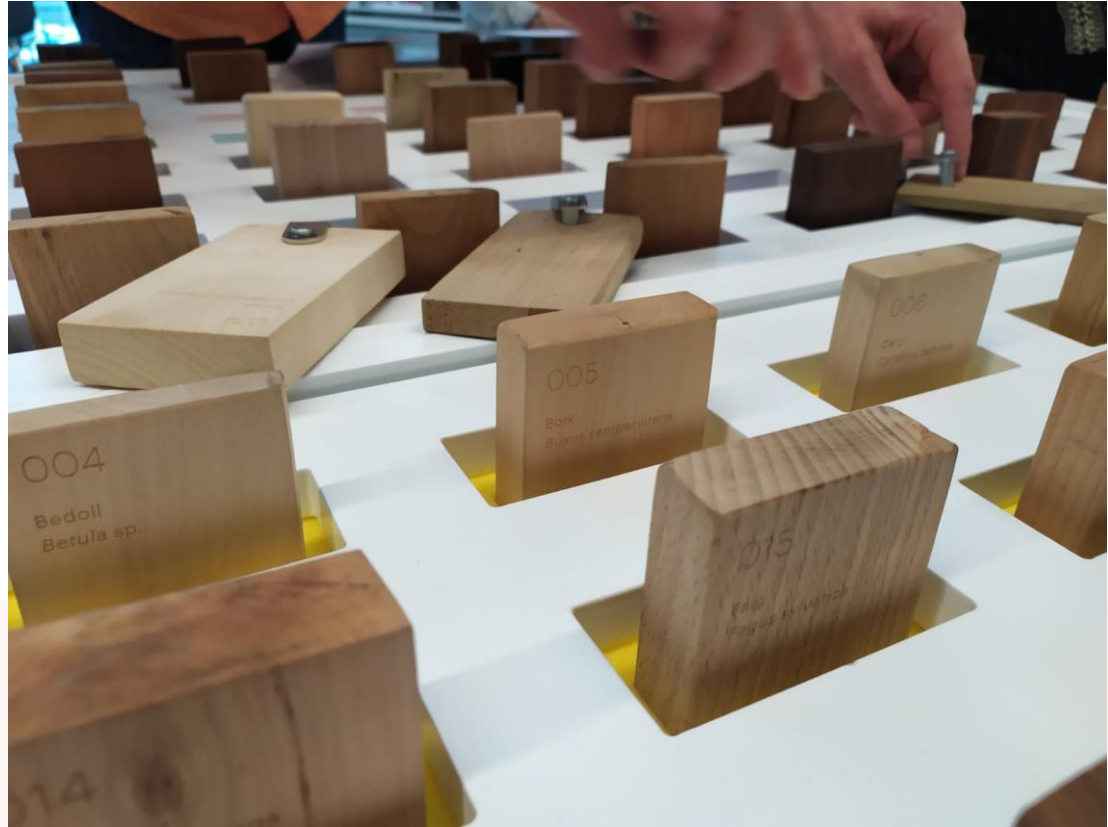
La xiloteca de l'Associació per a l'Estudi del Moble

Alguns exemples d'actuacions realitzades per a entitats públiques i privades: