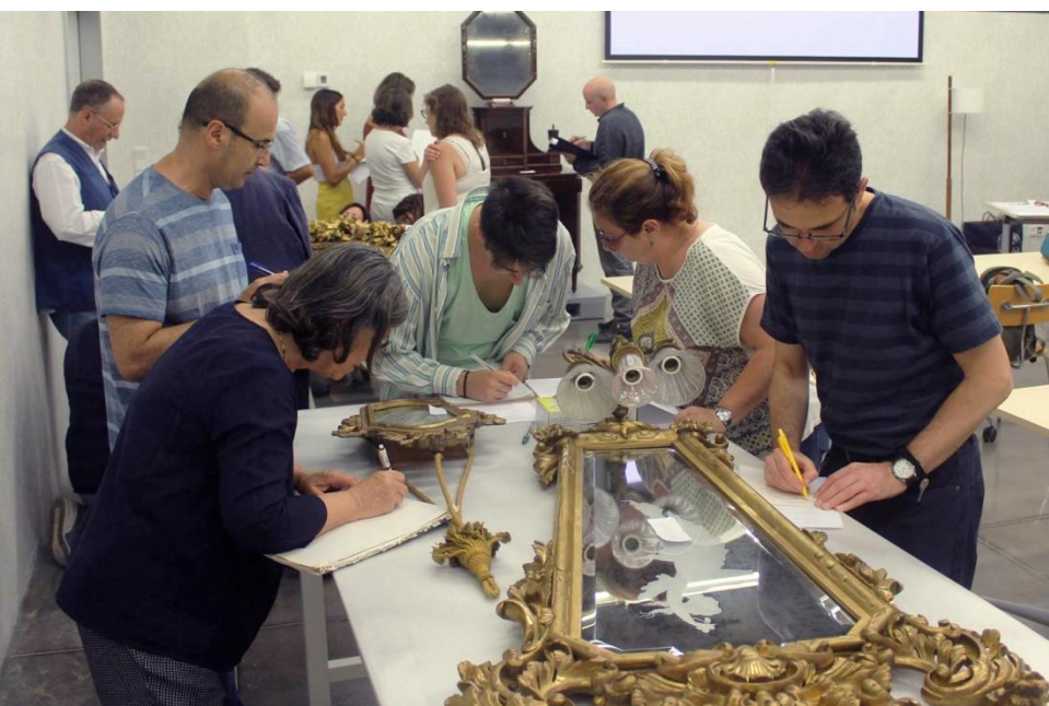
Catalogació de miralls

El fet diferencial és l'ensenyament en contacte directe amb obres. En els cursos i conferències es tracten temes sobre la història i la conservació del moble, així com de materials i tècniques aplicades. Anualment s'organitza una mitjana de set cursos en els quals participen reconeguts experts.