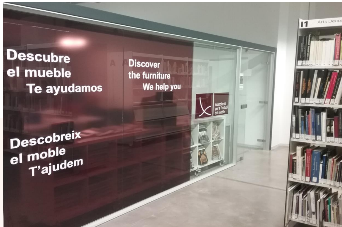
Seu de l'Associació per a l'Estudi del Moble

La seu de l'Associació es troba dins del Centre de Documentació del Museu del Disseny de Barcelona (CDOC). Per tal d'oferir un millor servei, la nostra biblioteca, l'arxiu i la xiloteca són gestionats pel Centre de Documentació, el que facilita la consulta dels llibres i el préstec quan és precís.