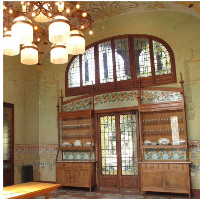
Menjador. Pavelló dels Distingits. Institut Pere Mata (Reus)

Visita a la Casa Navàs Plaça del Mercadal, 5-7. Reus