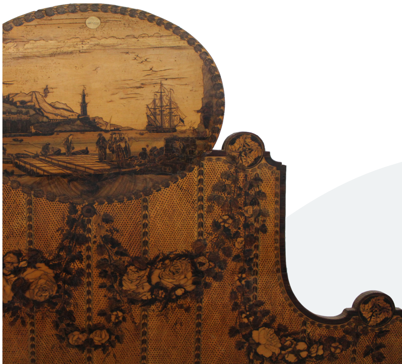
Imatge: Detall d'un capçal de marqueteria del Museu de la Garrotxa

Escola Superior de Conservació i Restauració de Béns Culturals de Catalunya