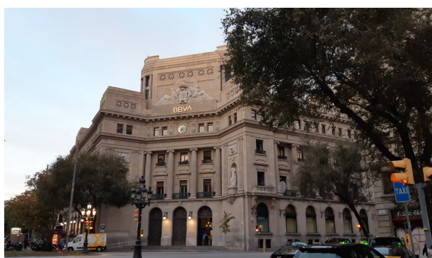
Fachada de la sede de BBVA en Catalunya