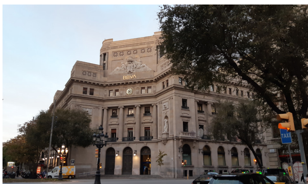
Façana de la seu de BBVA a Catalunya