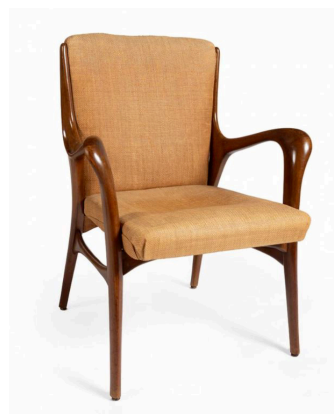
Cadira de menjador Dissenyada per Pere Cosp.