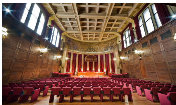
Sala A Imatge: Foment del Treball Nacional