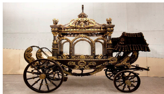
Foto: Carrossa fúnebre Collecció de Carrosses Fúnebres Cementiris de Barcelona