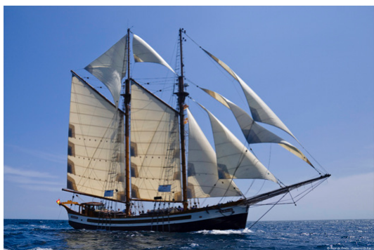
Foto: Jakt Far Barcelona Collecció d'Embarcacions Museu Marítim de Barcelona (MMB)