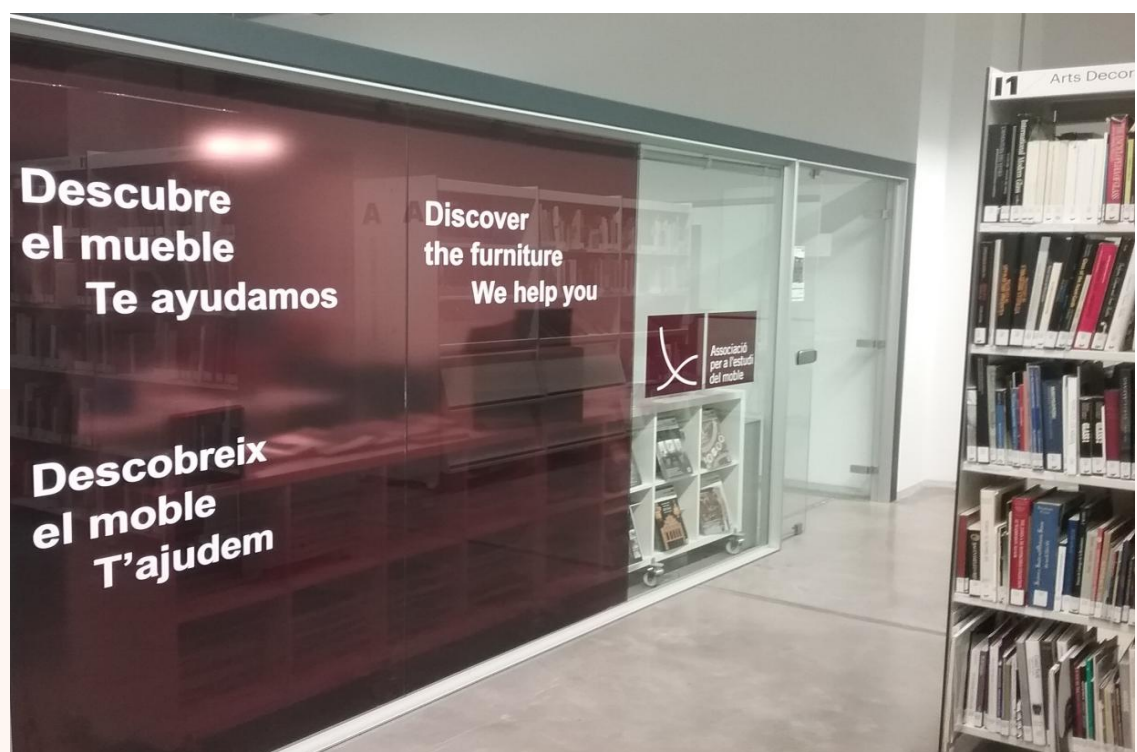
Sede de la Asociación para el Estudio del Mueble

La sede de la Asociación se encuentra dentro de la Biblioteca y Archivo del Diseño. Para ofrecer un mejor servicio, la biblioteca, el archivo y la Xiloteca están gestionados por Biblioteca y Archivo del Diseño, lo que facilita la consulta de los libros y el préstamo cuando sea preciso.