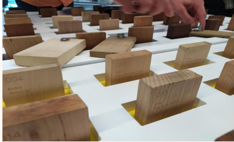
La Xiloteca de la Asociación para el Estudio del Mueble

Tanto la Xiloteca virtual como la venta de la Minixiloteca se pueden consultar a través de nuestra web.