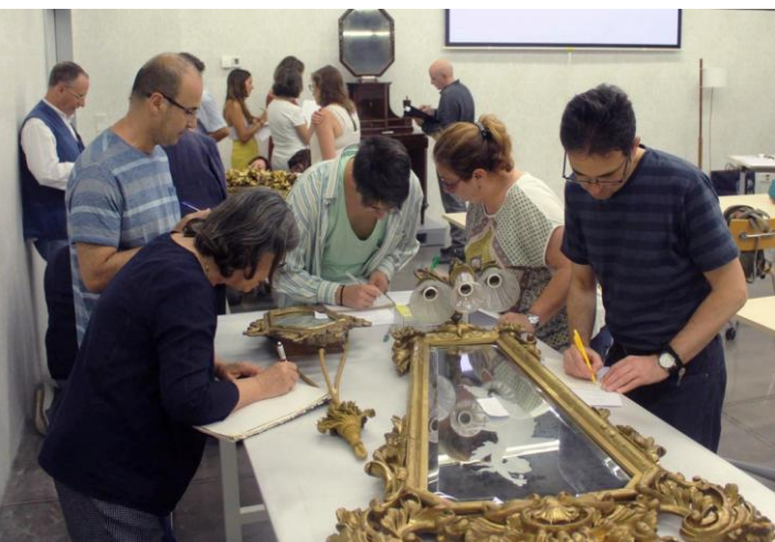
Catalogación de espejos

En nuestra web se encuentran todas las actividades de formación actualizadas, con información detallada sobre contenidos, fechas y requisitos.