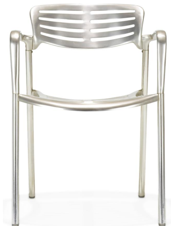
Silla Toledo. Jorge Pensi