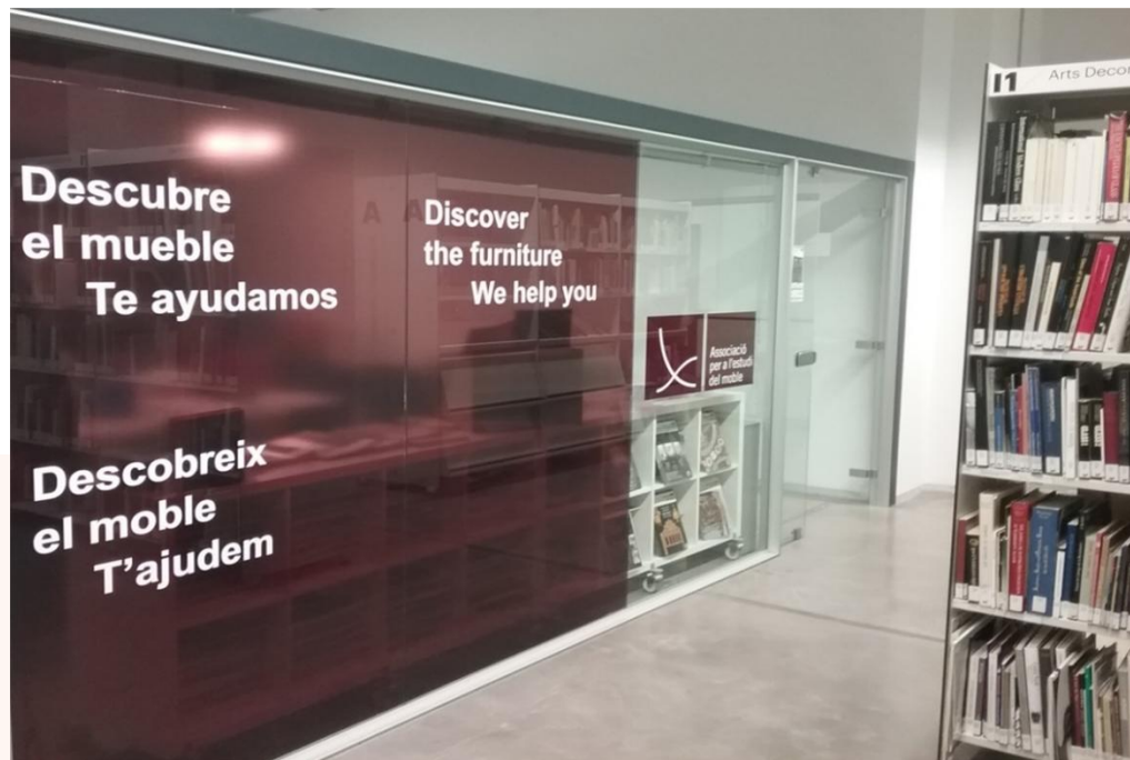
Seu de l'Associació per a l'Estudi del Moble

La seu de l'Associació es troba dins de la Biblioteca i Arxiu del Disseny. Per tal d'oferir un millor servei, la nostra biblioteca, l'arxiu i la Xiloteca són gestionats per la Biblioteca i Arxiu del Disseny, el que facilita la consulta dels llibres i el préstec quan és precís.