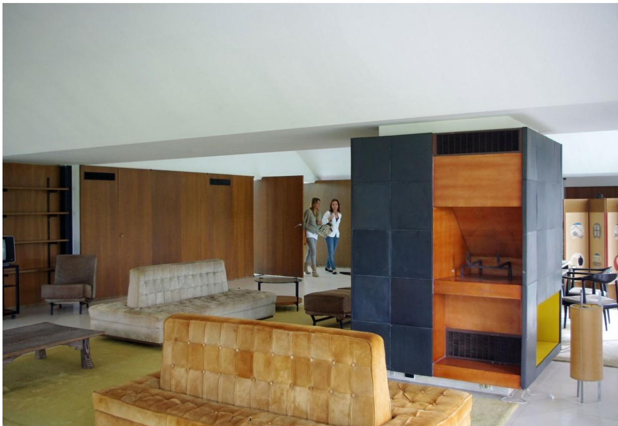
La Ricarda. Antonio Bonet

Per a més informació, podeu consultar el nostre web .