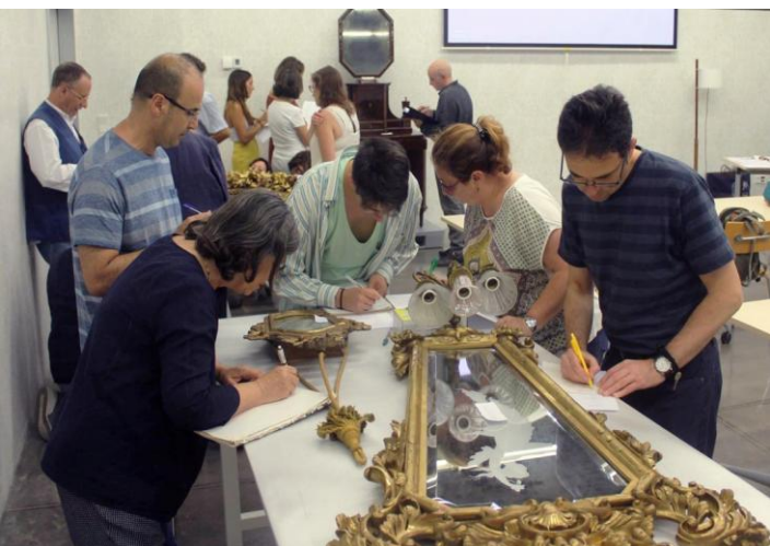
Catalogació de miralls

Al nostre web trobareu totes les activitats de formació actualitzades, amb informació detallada sobre continguts, dates i requisits.