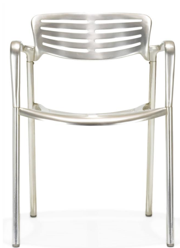
Cadira Toledo. Jorge Pensi