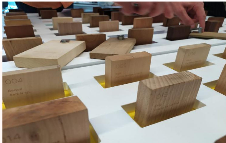
La Xiloteca de l'Associació per a l'Estudi del Moble

Tant la Xioteca virtual com la venda de la Minixiloteca es poden consultar a través del nostre web.