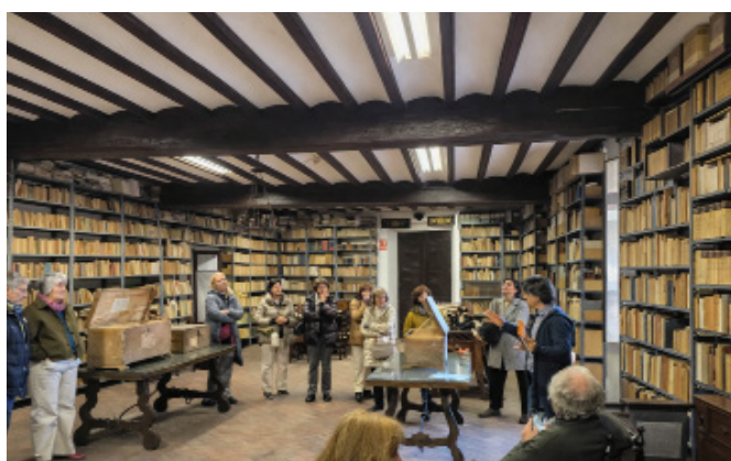
Arxiu i Biblioteca Episcopal de Vic. Imatge: AEM