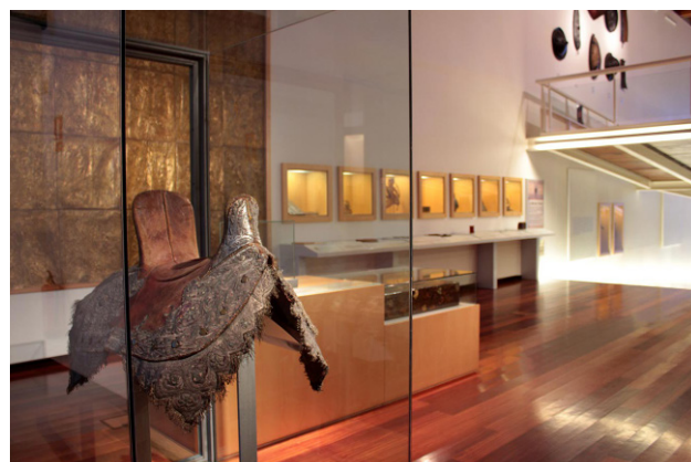
Museu de l'Art de la Pell.